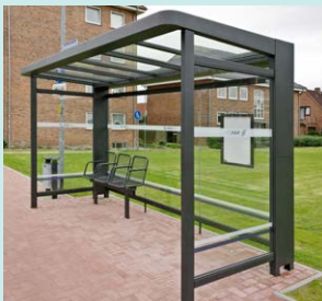
Nicht nur neue NAH.SH-Busse gab es für die Linie 6600, sondern auch Haltestellen im NAH.SH-Design.

Im ersten Entwicklungsschritt (12/2016) stand mit dem Ausbau der Linien 2581, 2582, 2583 und 2584 die Optimierung der wichtigen Verbindung der zentralen Orte Heide, Meldorf, Marne und Brunsbüttel im Mittelpunkt. Einen zusätzlichen