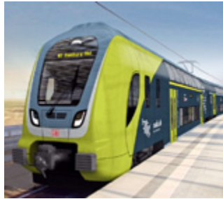
Kommen später: DB-Züge.

Die stündlichen Regionalexpressverbindungen Hamburg – Flensburg werden weiterhin mit SHE-Wagen bzw. den sogenannten n-Wagen gefahren. Dadurch variieren die Fahrzeiten nördlich von Elmshorn. Der Halt Owschlag wird ab Dezember